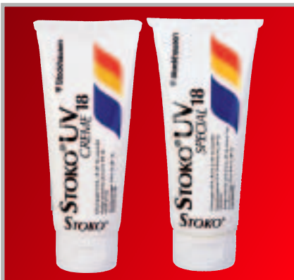
Stoko UV 18 / UV 18 special