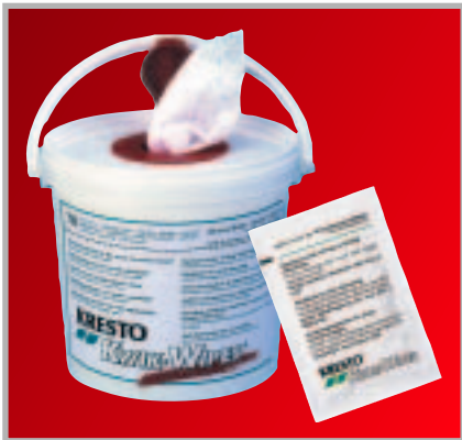
Kresto kwik wipes