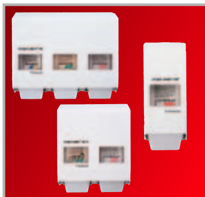
Stoko Vario Tri / Stoko Vario SVP / Stoko Vario Duo