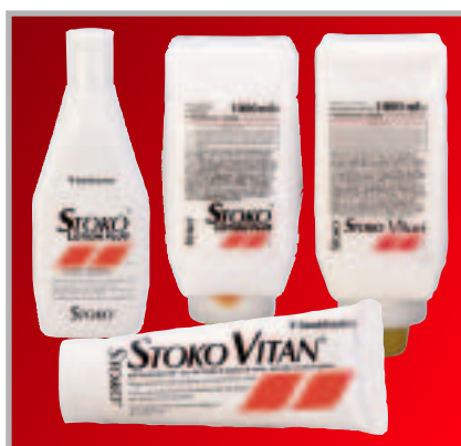
Stoko Lotion Plus / Stoko Vitan