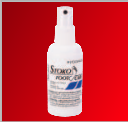
Stoko Foot Care