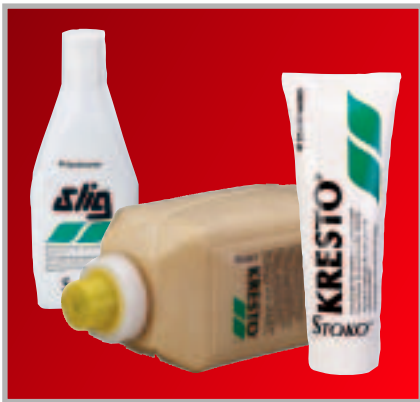
Slig / Kresto