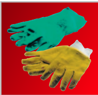
Schutzhandschuhe Mapa /Latex