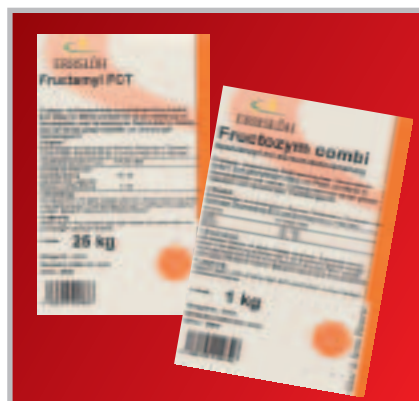
Fructamyl FCT / Fructozym Combi