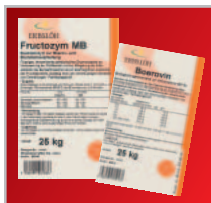
Fructozym MB / Boerovin