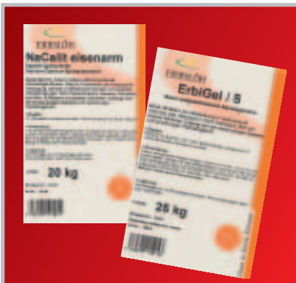
NaCalit / ErbiGel