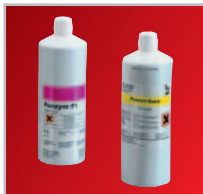
Panzym F1 / Extra