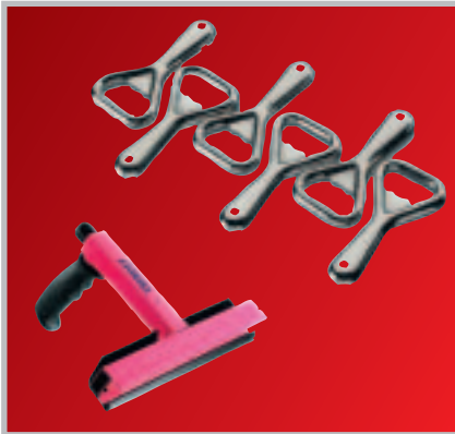
Öffner / Multi-Öffner