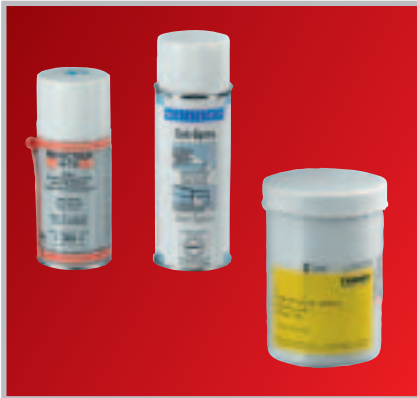
Rostlöser / Vaseline