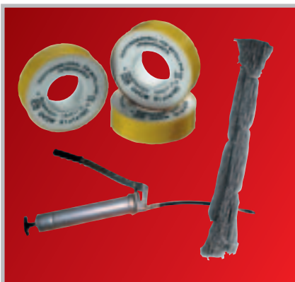
Fettpresse / Teflonband / Palettenschnüre

Gebinde: Artikelnummer 1 kg-Dose B111-90014