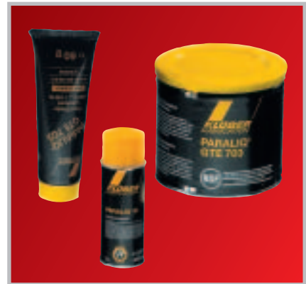
Paraliq GTE 703/91-Spray