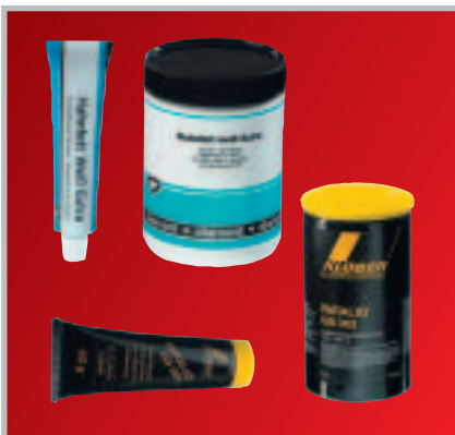
Hahnenfett „DIAMANT“ / Paraliq GB 363